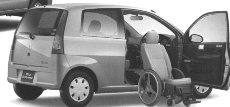
ミラ セルフマチック