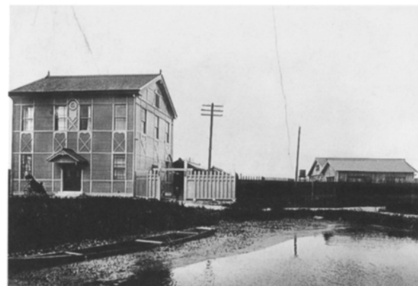
ダイハツ工業の前身、「発動機製造（株）」の創立当時の事務所（左）と、工場（右）