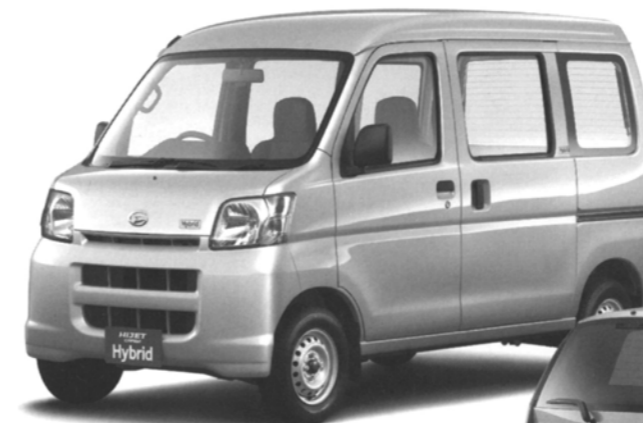
ハイゼットカーゴ ハイブリッド

ダイハツには昭和40年代から電気自動車、ハイブリッド車の販売を行った歴史がございます。本年9月には軽商用車では初めてのハイブリッド車「ハイゼットカーゴハイブリッド」を発売いたしました。現在公道試験中