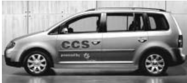
CCSエンジンを搭載したトゥーランのプロトタイプ

果のある市場シェアを獲得するまでには、少なくとも20～30年を要すると考えられます。従って、電気駆動システムを実現させるという長期的目標と並行して、近い将来においてサステナブル・モビリティに段階的に近づいていくための、第2の戦略を展開していくことが不可欠となります。