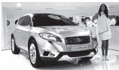
Suzuki S-CROSS concept. C セグメント市場参入を予告