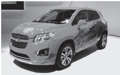
GM Chevrolet TRAX. 2013 年発売予定のクロスオーバー SUV