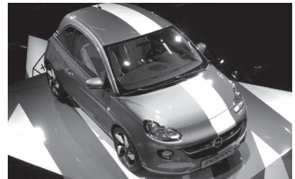
Opel / Vauxhall ADAM. MINI より小さく 500 より大きい再生オベルの新星