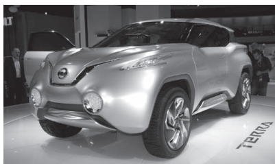
Nissan FCEV "TERRA" concept. 燃料電池搭載の SUV