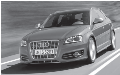
Audi S3. ホットモデルは 2.0 / 300ps!

ショー全体の傾向ではD/Cセグメント、いわゆる中小型車クラスの充実と品質向上が注目に値する。公平に見て日本車はこの分野でデザイン的にも優位に立っているとは残念ながら言い難い。紙数に余裕がないので主なものを写真とキャプションで紹介する。