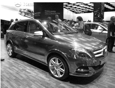
Mercedes-Benz B-Klasse EV. 1 チャージ 200km! 2014年発売