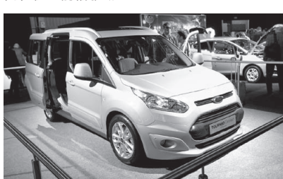
Ford TOURNEO. 世界戦略小型商用車