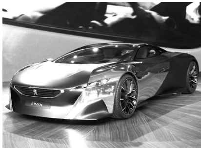
Peugeot ONYX. ディーゼル・ハイブリッド