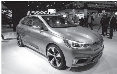
BMW Active Sport Tourer PHV concept. 同社初の前輪駆動!