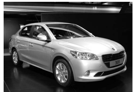
Peugeot 301. Citroën C Elysee と兄弟