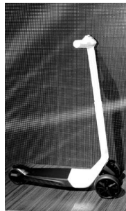
キックスクーター