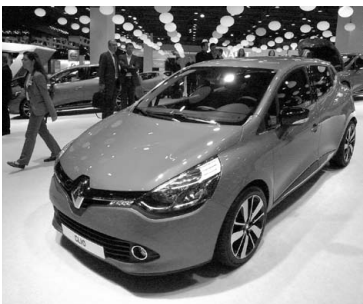
Renault CLIO. 日本名ルーテシア