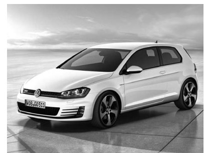
Volkswagen GOLF 7 GTI. 2013年発売