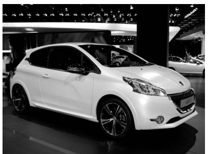
Peugeot 208. 車体を縮小軽量化