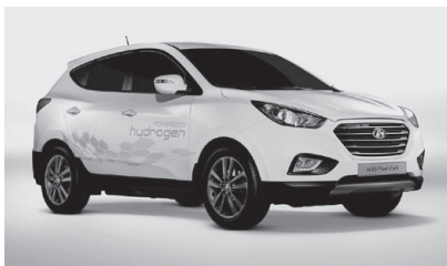
Hyundai ix35 FCEV. 世界初の量産型燃料電池車が発売間近