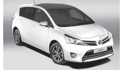
Toyota VARSO S. 日本では新型ラクティスに