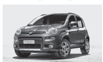
Fiat PANDA. 4 x 4. 初代の面影は消滅