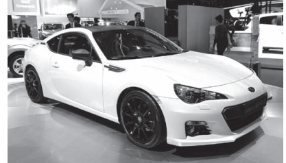
Subaru XT LINE concept. ベースは BRZ