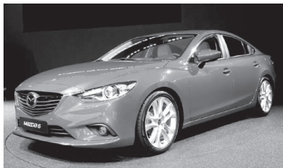
Mazda ATENZA. モスクワでセダン パリでワゴンを発表