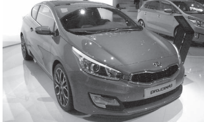
Kia PROCEED. 2013 年発売予定の C セグメントカー