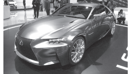
Lexus "LF-CC" concept. ハイブリッドの高性能スポーツ