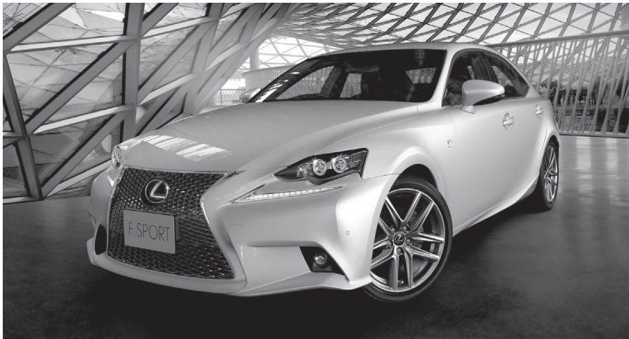
IS350 "F SPORT"

一口に「もっといいクルマ」といっても、お客様の使い方やクルマに求めるものは、様々です。